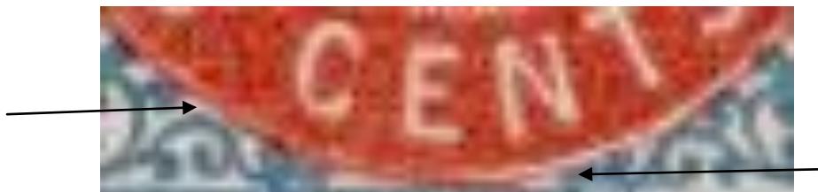
Tryk 7 pos 29

Bule på ovalinie mellem 3 og C samt tynd ovalinie hvor regnbuen ender.